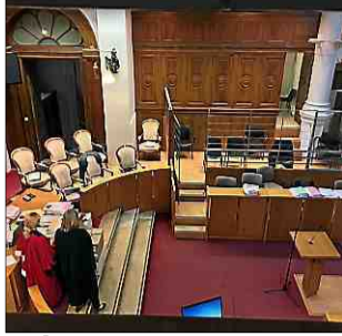
■ Éric Coussinet sera dans le box des assises. H.R.

L'enquête de la police scientifique a établi l'existence de cinq départs de feu. Éric