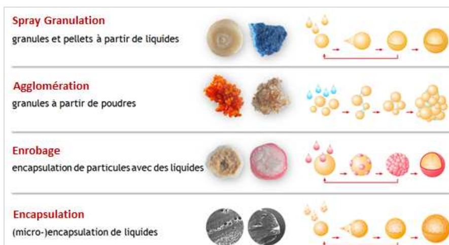
Figure 1: Illustration des procédés de granulation par voie humide www.glatt.com