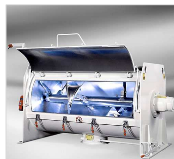
Figure 2 : Mélangeur-granulateur à socs

Une fois les grains formés, une double enveloppe peut être utilisée pour réaliser une étape de séchage (sous vide ou en augmentant la température à l'intérieur de la cuve).