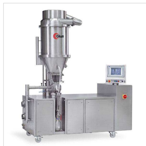
Figure 3 : Procell Labsystem à SDTech

En effet, l'utilisation d'un air de fluidisation à température ambiante peut être suffisante pour le séchage d'une solution aqueuse. Cependant, la possibilité de chauffer cet air de fluidisation permet également de travailler avec des matériaux nécessitant un apport de chaleur important.